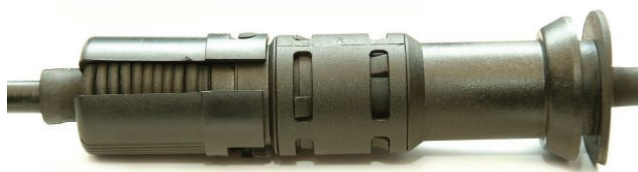
Rys. 1: Zabezpieczenie z zamknięciem bagnetowym

U nowych linek sprzęgła automatyczny mechanizm regulujący jest zabezpieczony za pomocą zamknięcia bagnetowego (Rys. 1) lub białego paska plastikowego. (Rys. 2).