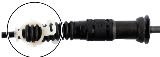
Rys. 5: Zabezpieczenie poluzowane (białym paskiem plastikowym)