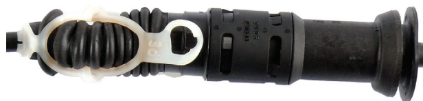
Rys. 2: Zabezpieczenie z białym paskiem plastikowym